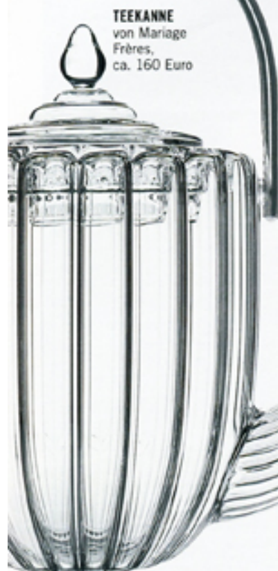
TEEKANNE von Mariage Frères, ca. 160 Euro