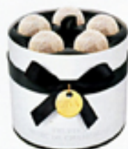
„DIVA“-TRÜFFEL (Marc de Champagne) von Lindt, ca. 16 Euro

SO PUR WIE GUTER TEE Die Hamburger „t.boutique“ (l., www.t-lovers.de ) und der Concept Store „Paper & Tea“ in Berlin ( www.paperandtea.com )