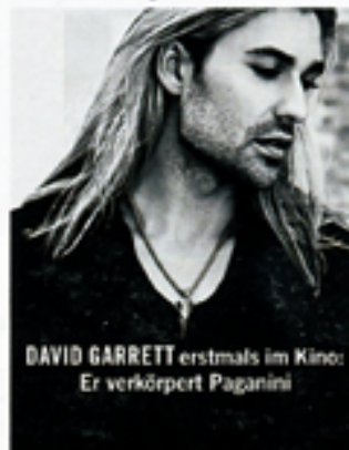
DAVID GARRETT erstmals im Kino: Er verkörpert Paganini

Die Musik. Es gibt nur selten einen Tag, an dem ich nicht an sie denke. Im Moment ist meine Geige für mich Beruf, Hobby, Leidenschaft und Ablenkung.